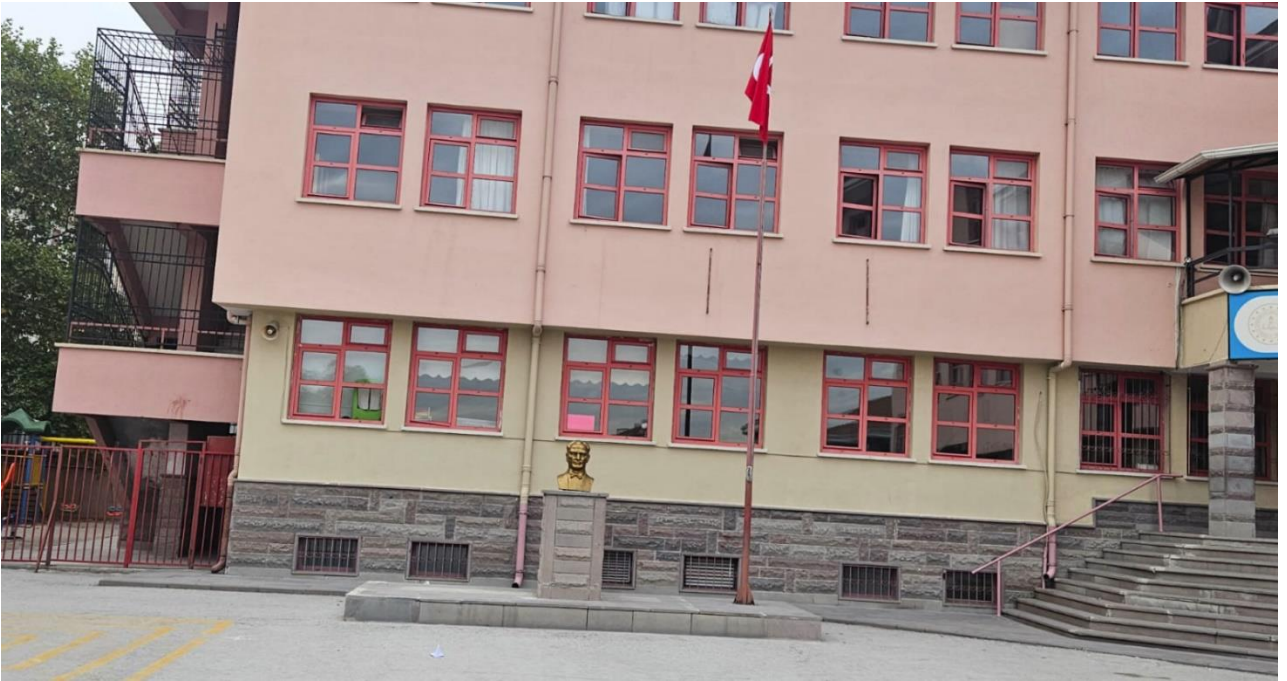
Şekil 4. Emin Sağlamer Ortaokulu Dış Görünüş-2