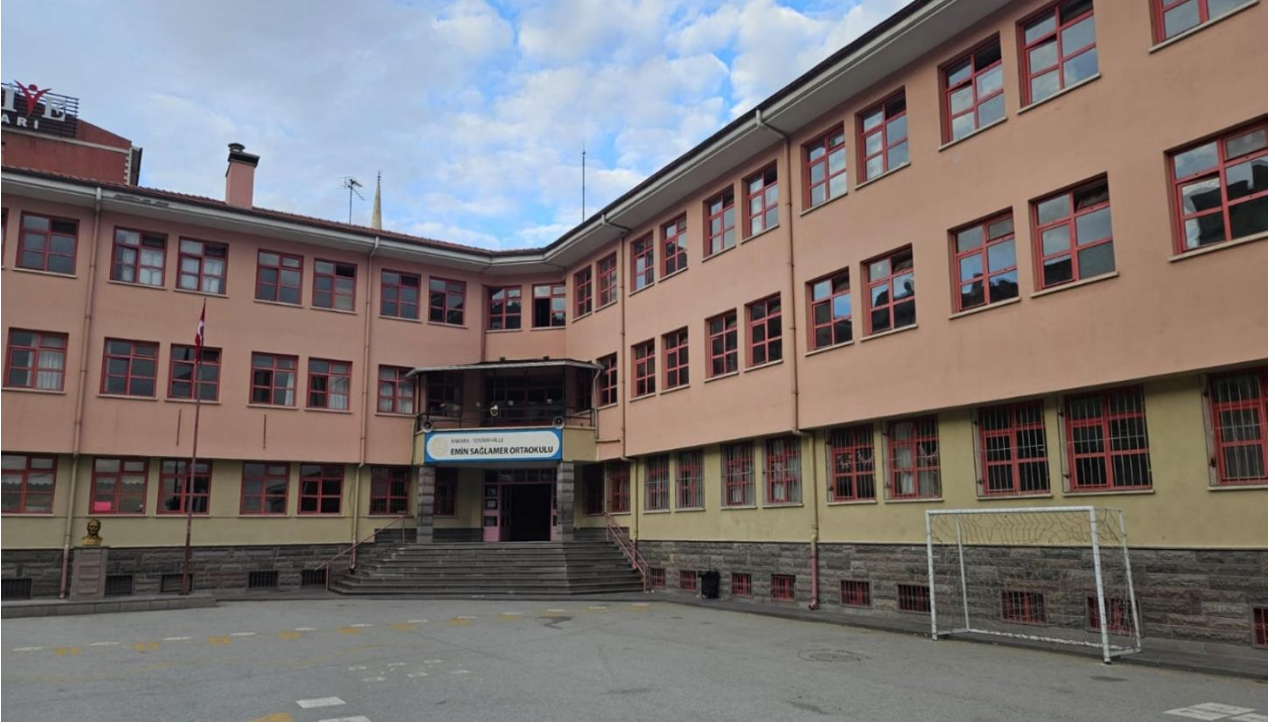
Şekil 3. Emin Sağlamer Ortaokulu Dış Görünüş-1