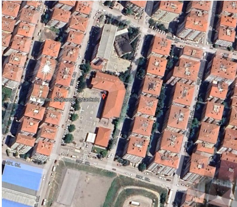
Şekil 2. Emin Sağlamer Ortaokulu Konumu